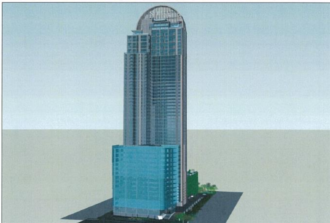
รูปที่ 2.3-1 แบบจำลองอาคารโครงการ

โครงการเป็นอาคารชุด สูง 56 ชั้น จำนวน 1 อาคาร มีพื้นที่อาคารรวมที่ใช้คิดอัตราส่วนกับพื้นที่ดิน 150,870 ตร.ม. ดังแสดงแบบจำลองอาคารโครงการในรูปที่ 2.3-1 และการใช้ประโยชน์ พื้นที่แต่ละชั้นดังตารางที่ 2.3-1